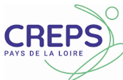
Médecin du sport Psychologue Diététicienne Kinésithérapeute