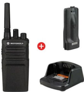
12 Talkies-Walkies ⇒ 2 493 €