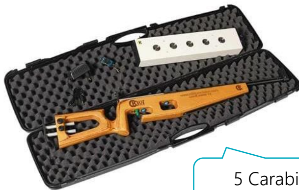
5 Carabines laser ⇒ 8 055 €