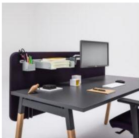
Aménagement bureau ⇒ 16 672 €