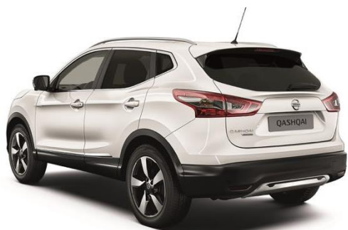
Véhicule Ligue ⇒ 22 767 €