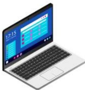
Pc Portable ⇒ 2 395 €