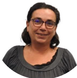
Sous convention avec le CD 44 de Natacha LAPPARTIEN ⇒ Spécialité : Sprint-Haies