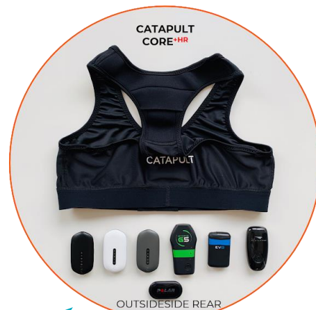
5 vestes GPS ⇒ 4 800 €